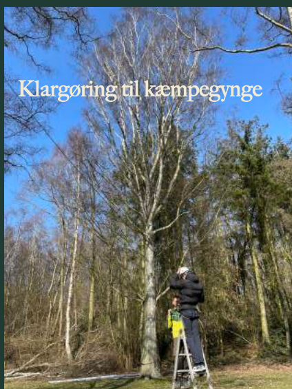
Klargøring til kæmpegynge

Lokation og sikkerhed Når vi tager jer "På Skovtur" er det med afsæt i Nordskoven der strækker sig langs kysten fra Rønne til Hasle. En fantastisk legeplads med masser af muligheder – her er læ, plads og sikre rammer.