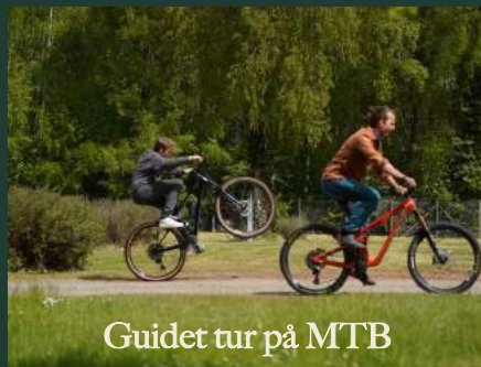
Guidet tur på MTB