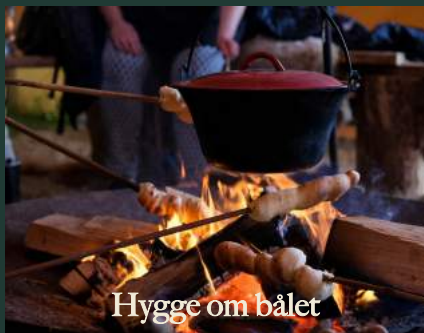
Hygge om bålet