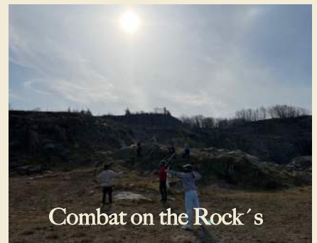
Combat on the Rock's