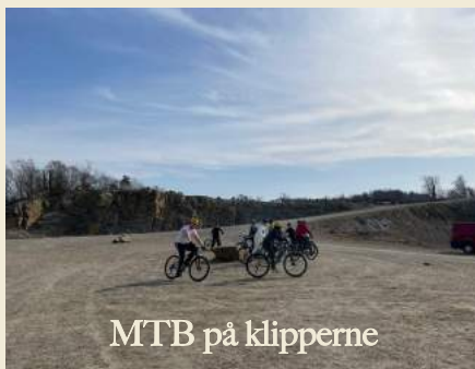
MTB på klipperne