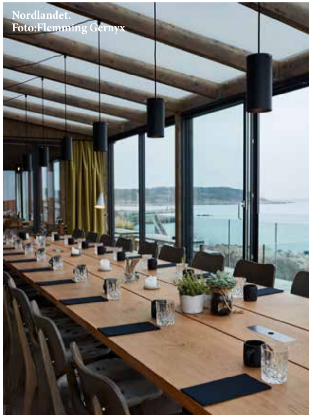
Nordlandet.