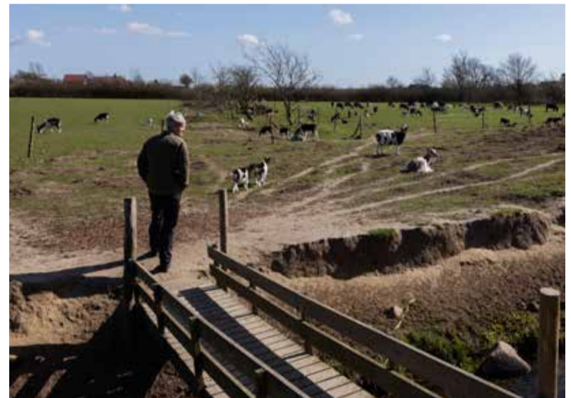
Lykkelund Gedemejeri producerer gedeoste og is, som blandt andet sælges til lokale restauranter.

Det er en fjer i hatten, når gode restauranter foretrækker gedeost lavet af Lene og Lene, men Lykkelund Gedemejeri er også historien om, hvor hårdt det er at være økologisk producent.