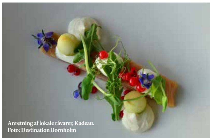
Anretning af lokale råvarer, Kadeau.